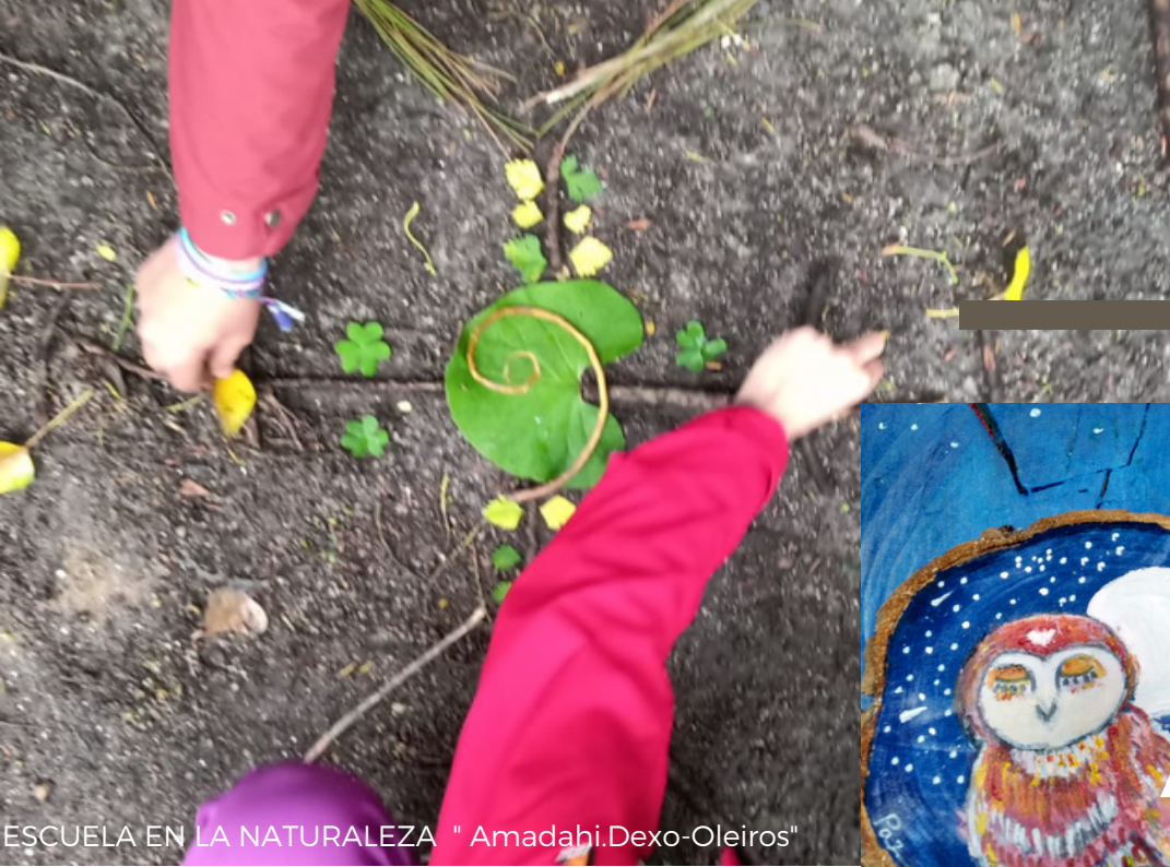
ESCUELA EN LA NATURALEZA " Amadahi.Dexo-Oleiros"