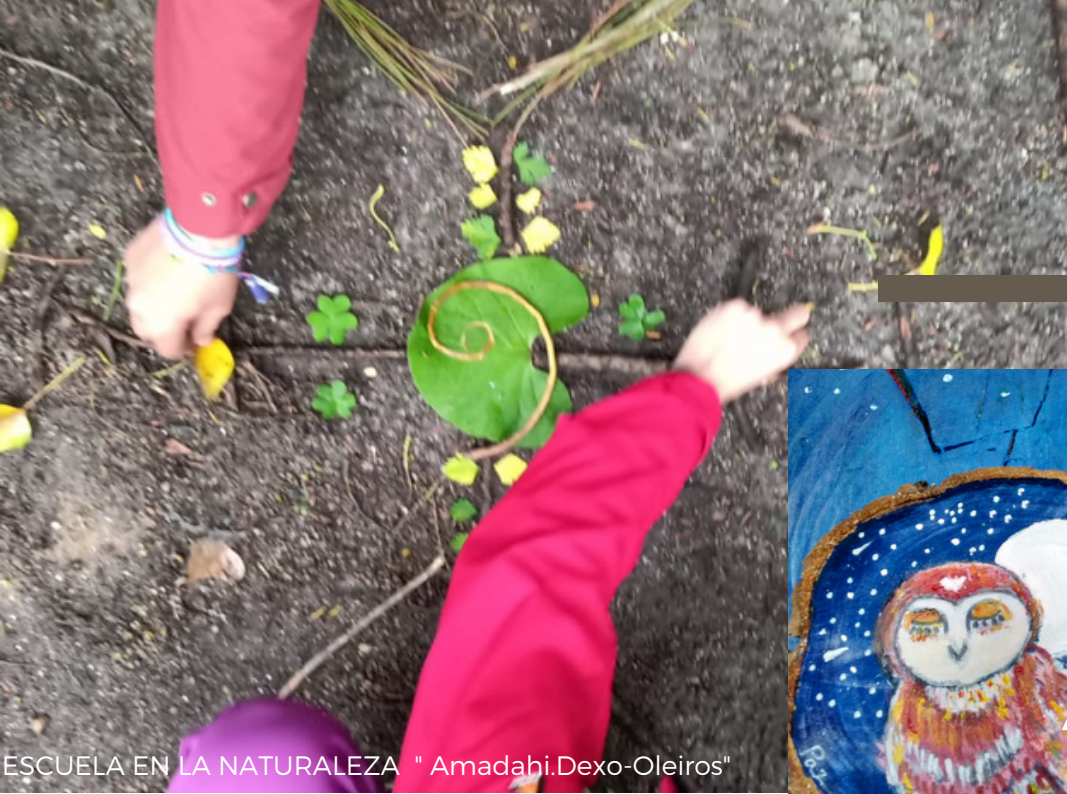
ESCUELA EN LA NATURALEZA " Amadahi.Dexo-Oleiros"